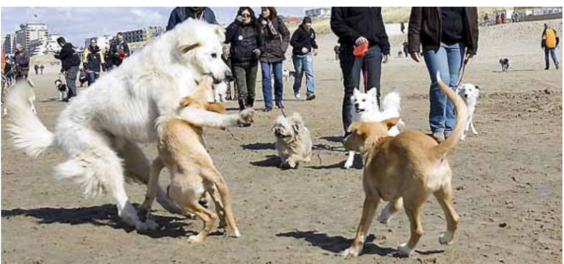
Lekker ravotten op het strand, maar wat als het uit de hand loopt?

„Toch is ook het standpunt dat de betreffende verzekeraar heeft ingenomen niet onverdedigbaar. Ik kan niet uitsluiten dat een rechter de gedragingen van de honden gaat vergelijken met sport- en spelsituaties bij mensen.