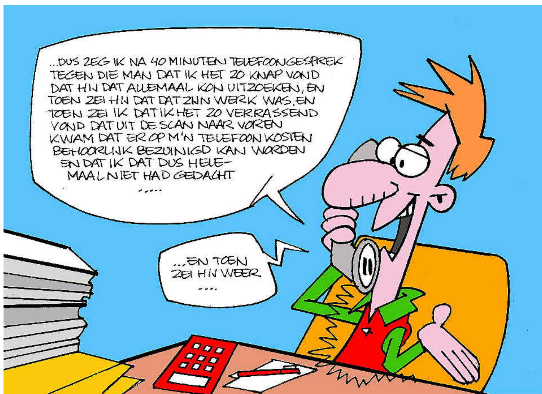
ILLUSTRATIE MARC DE BOER

Dat blijkt uit onderzoeken van de Consumentenbond en uit de ervaringen van vijf lezers, die van ons en Stichting Besparingsplanner een gratis scan van hun huishoudboekje kregen. Gemiddelde besparing per gezin per jaar: € 853,77.